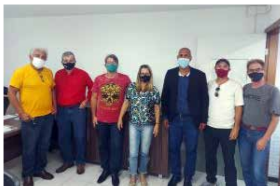
Conquista: audiência com o Secretário de Educação de Vila Velha confirma vacina para categoria