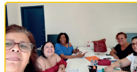
Visita à UMEF Antônio Lorenzetti

Os/As diretores/as do SINDIUPES têm feito visitas às escolas para levar informações das atividades e destacar a importância de se filiar a um sindicato que defende os direitos dos/as filiados/as, sempre ouvindo as reivindicações da categoria para dar os devidos encaminhamentos.