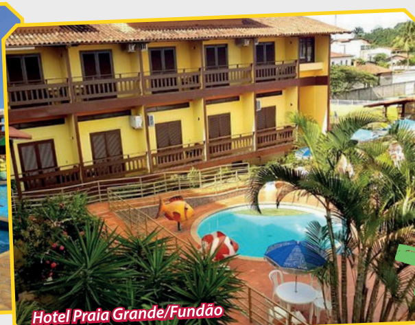
Hotel Praia Grande/Fundão

Entre os convênios oferecidos pelo SINDIUPES estão: Clubes, Hotéis, Pousadas, Médicos, Psicólogos, Dentistas, Farmácia, Academia, Restaurantes, Óticas, Cursos, Papelarias, Supermercados e Comércio em geral.